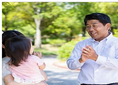
しもの六太オフィシャルサイトより